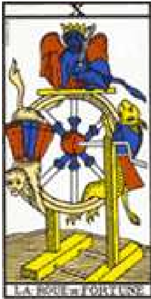
Tarot de Marsella

Si el Ermitaño induce al hombre a la búsqueda solitaria, el arcano X, la Rueda de la Fortuna, nos vuelve a sumergir en el mundo y sus pruebas, en el ciclo de las fluctuaciones: felicidad-infelicidad, ascensión-descenso, fortuna-infortunio, alegría-tristeza, etc. Se le relaciona con Zeus e Indra, con la encina, el álamo, la higuera, la piedra amatista y-o el lapis-lázuli.