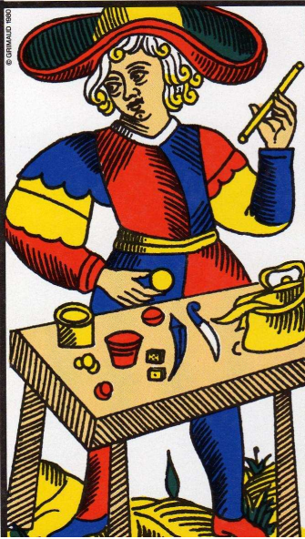
Tarot de Marsella

Al estar asociado a la simbología del uno, nos indica comienzo, actividad, iniciativa, lo manifestado que antes fue pensado pero no plasmado. Está en la vía solar, por lo tanto lo activo y la extroversión.